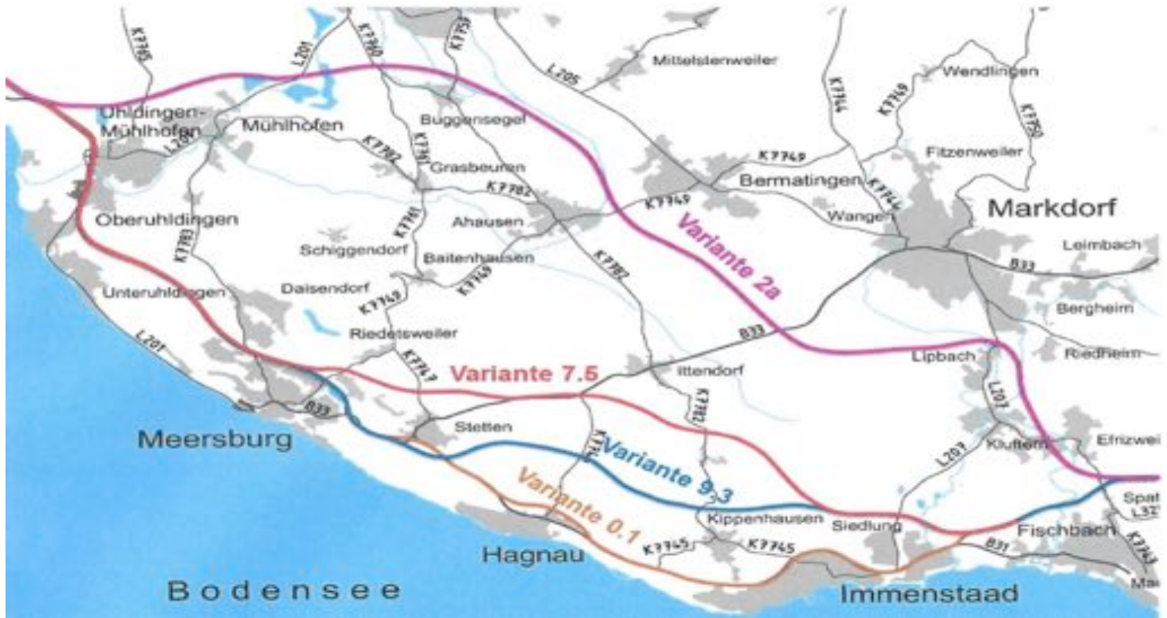
Varianten im Raumordnungsverfahren 1999